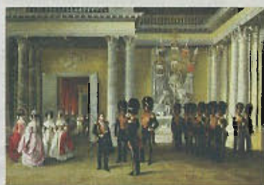
'Interiors of the Winter Palace', Adolphe Ladurner.

Een podium wordt opgericht op het grote plein voor het Winterpaleis in Sint-Petersburg, onderdeel van het gigantische Hermitagemuseum. De noordelijke Russische stad zit midden in de feesten van de Witte Nachten. 's Nachts wordt het er niet meer donker. En dat moet gevierd worden. In de binnentuin van het paleis wacht een lange sliert bezoekers geduldig bij de hoofdingang. Voor de speciale gast is er een andere ingang, vijf minuten verder lopen, via het bekende Wintergrachtje, aan de zijde van de Neva, de brede rivier door Sint-Petersburg. De gelijkenis met Hermitage Amsterdam is er zeker, alleen is alles hier groot, groot en nog eens groot. Een binnentuin met een ingang, net zoals in Amsterdam, de gebouwen geflankeerd door een rivier en een gracht. De Amsterdamse Hermitage, zo ruim als die is voor Nederlandse begrippen, is een miniatuurtje hiermee vergeleken. Bij het binnentreden van de achteringang wordt de gast geconfronteerd met enorme zalen, prachtige marmere vloeren,