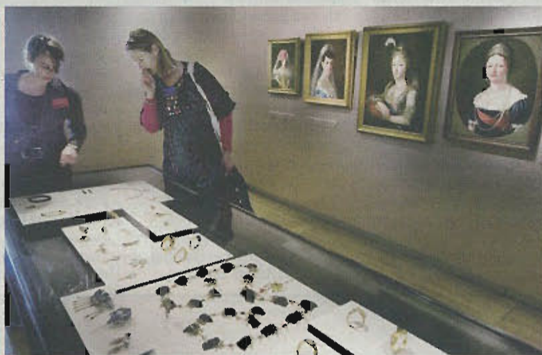
Een kijkje in de Hermitage Amsterdam, die morgen open gaat voor publiek. De openingstentoonstelling 'Aan het Russische hof' toont 1800 objecten uit het moedermuseum in Sint-Petersburg.

heen naar buiten kunt kijken. De noord- en zuidvleugel zijn ingericht als grote tentoonstellingszaal, omgeven door 42 kleine kabinetten, waar elk half jaar een nieuwe expositie wordt ingericht. De tuinvleugel is de ontmoetingsplek voor het publiek met een restaurant met buitenterras dat ook buiten openingstijden van het museum toegankelijk is (dagelijks tot 1 uur 's nachts), twee winkels en een auditorium. In de Amstelvleugel zijn twee vaste presentaties. Eén zaal is gewijd aan de relatie tussen Nederland en Rusland – aan de Hermitage in Sint-Petersburg en die in Amsterdam. De andere zaal richt zich op de geschiedenis van Amstelhofen en de zorg van de Hervormde diaconie voor de 'oude besjes'. Deze presentatie strekt zich uit over de regen-