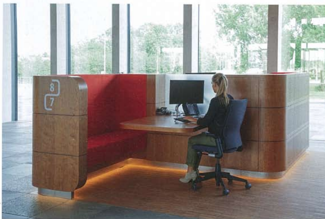
FOTO BOVEN Publiekshal met publieksbalies en ronde glazen lift