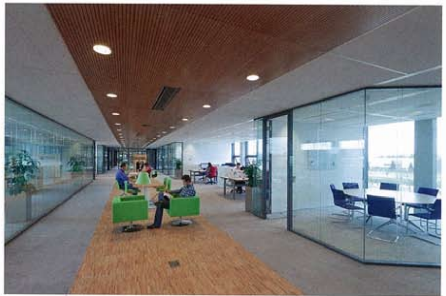
FOTO BOVEN Vergaderplekken en zitjes op het middenpad van de kantoorvleugel