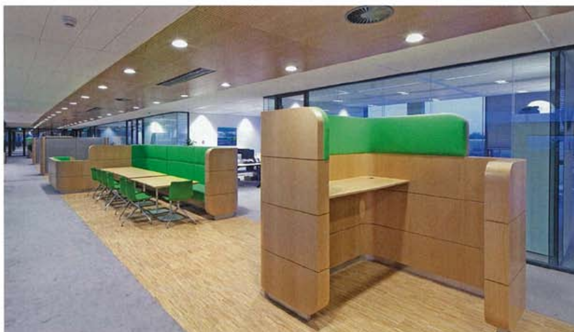
FOTO ONDER: BEL- EN WERKPLEKKEN MIDDENZONE KANTOOR- VLEUGEL.