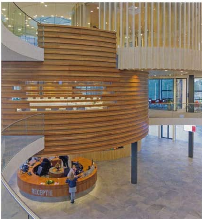
FOTO GEHEEL LINKS: PUBLIEKSHAL VANAF TE VERDIEPING.