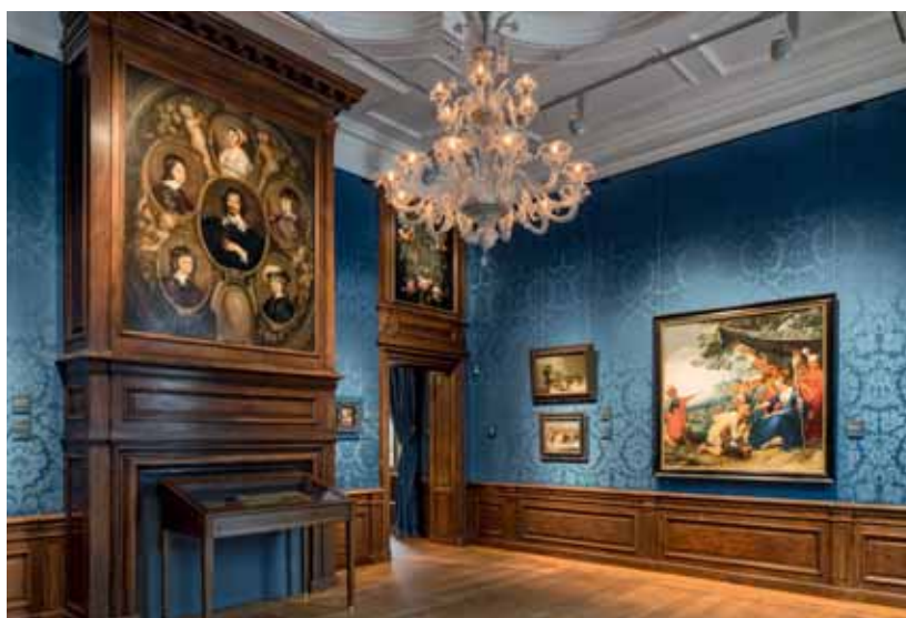
FOTO ONDER Een van de kabinetten, met wandbespanning van zijde en Murano-kroonluchter.