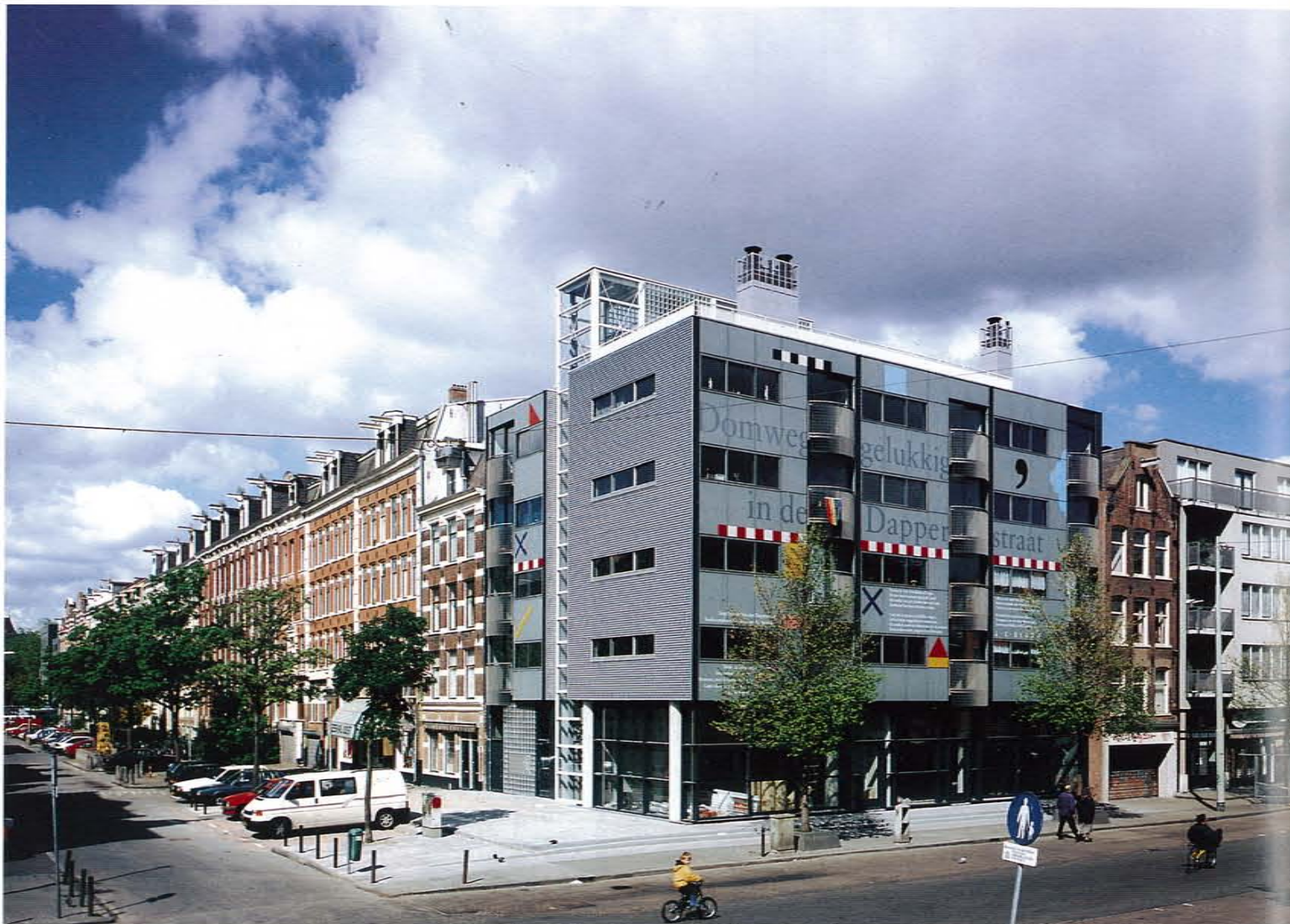
hoek Dapperstraat/Commelinstraat corner

Drie invulprojecten in de Dapperbuurt laten een uniforme aanpak zien. Diverse woningtypen gaan schuil achter strakke vliesgevels. Transparante glazen liften en trappenhuisen koppelen de blokfragmenten en relateren het leven achter de gevelvlakken aan de straat. De dichtregels en tekens op de gevels zetten de wat wijkende grijze vlakken op hun plaats vast en introduceren detail in een architectuur die juist ieder zichtbaar detail tracht te vermijden. Het project poogt aan te tonen dat het technische niveau van gevelafwerking in de kantorenbouw ook in de woningbouw is te realiseren.