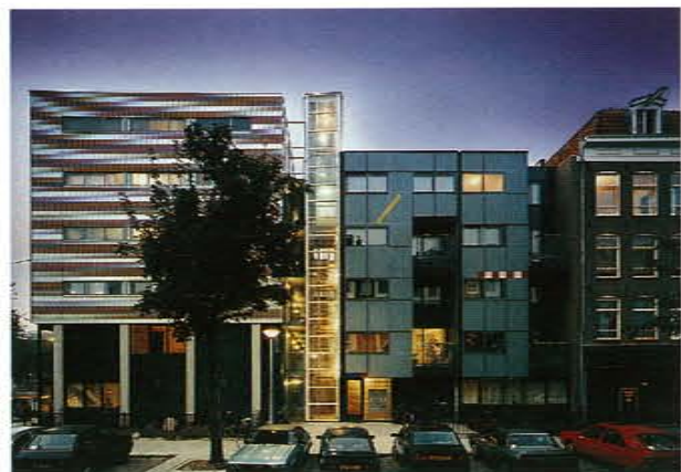
hoek Linnaeusstraat/Commelinstraat corner