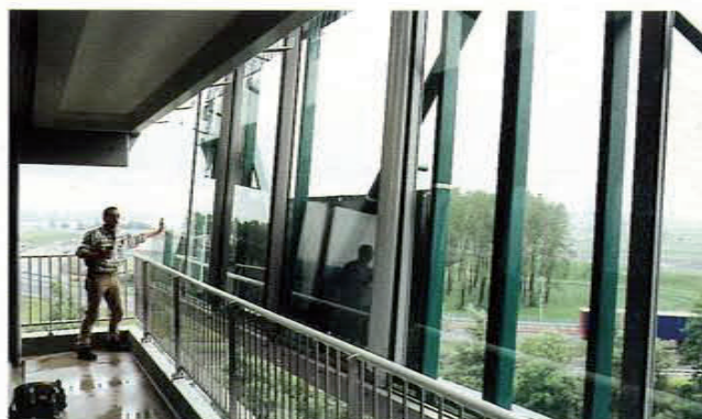
De prefab puien worden met een speciale hijsbeugel van de glasbok gehesen.

aanbrengen van permanente ventilatie in de profielconstructie is voorkomen dat aan extra eisen moest worden voldaan, zoals die op het gebied van brandwering en thermische isolatie aan een verblijfsruimte worden gesteld. De Noordwachter telt veertien woonlagen en heeft een hoogte van 42 meter. De trek- en zuigkrachten die op het grote geveloppervlak werken, zijn berekend op maximaal 180 kg/m 2 . Om die reden zijn de betonnen bordessen, waar de puien aan hangen, extra geborgd.