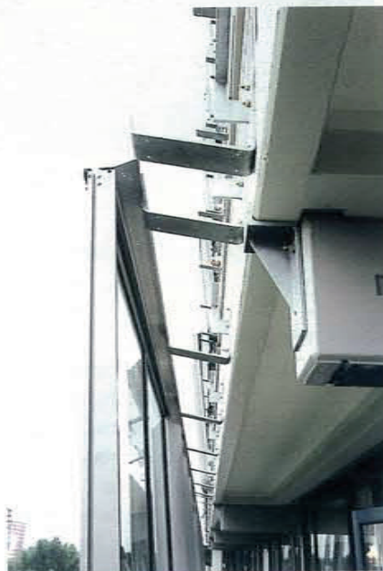
Een ingehangen pui met de extra bordes- versterking goed zichtbaar.

Bovendien zat het balkonhek, dat is gehandhaafd, in de weg. Toegepast is 66.2 gelamineerd glas, totaal ruim 4000 vierkante meter, geleverd door Pels & Joosten. Het glas is in de vaste vakken voorzien van rubberen afdichting; in de schuivende vakken zijn de ruiten gekit beglaasd.