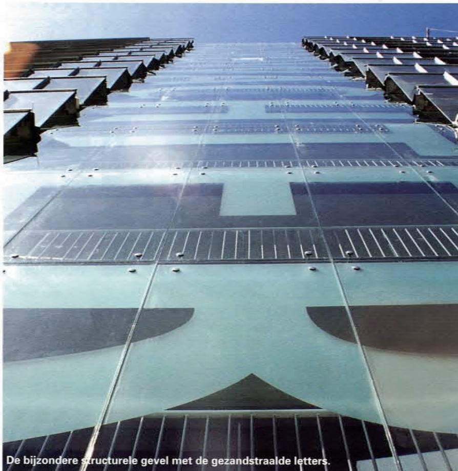
De bijzondere structurele gevel met de gezandstraalde letters.

Om contactgeluid te vermijden, hangt elke pui per bordes separaat aan de beugels en is tussen de pui een T-profiel met kunststof afdichting toegepast. Aan de kopse kanten van de flat is het glas doorgezet, eveneens in een helling van 7 graden. De hoekverbinding van het glas is daar voorzien van een gekitte naad. De serres, die zijn ontstaan door de balkons in feite volledig met glas af te dichten, zijn bewust niet als leefgebied beschouwd. Door het