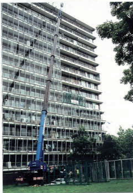
Blik op de montage met behulp van de kraan.