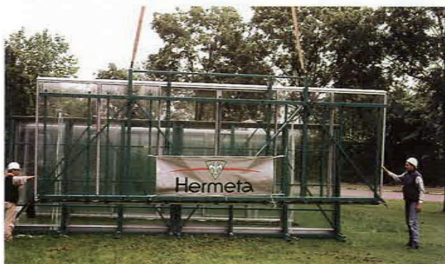
De 7,80 meter brede pui wordt in één keer ingehangen, waarbij de speciale hijsbeugel onmiddellijk voor de juiste helling zorgt.