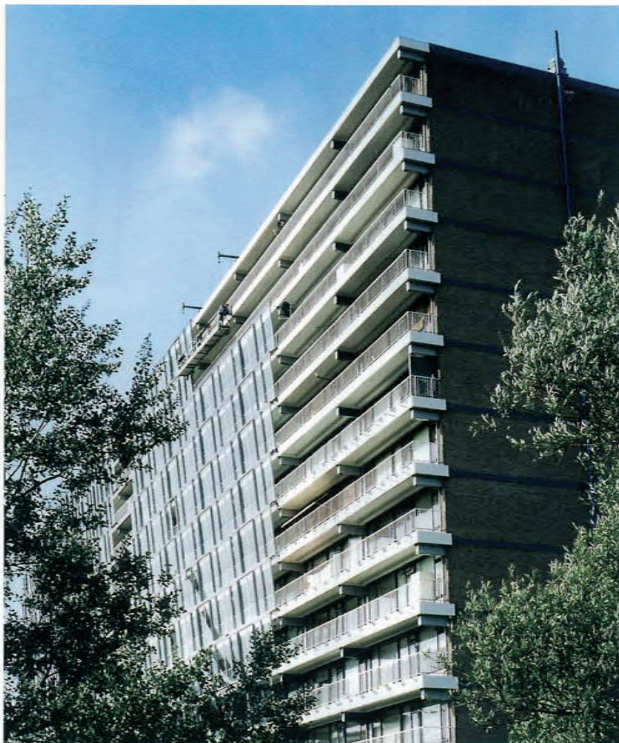
De Noordwachter tijdens de montage van de serregevels.

De Noordwachter en Brandaris behoren tot de bekendste vuurtorens van het land. Twee flats in Zaandam, zijn vernoemd naar de torens. Maar waar de zee en het strand doorgaans rust symboliseren, grenzen de flats aan de drukke A8 vlakbij knooppunt Zaanstad. Door de bouw van flyovers is de verkeersintensiteit, -snelheid en daarmee het -lawaaï alleen maar toegenomen. Een technisch hoogstaand geluidsscherm van glas, niet grenzend aan de weg, maar gemonteerd aan de flatgalerijen, biedt een afdoende oplossing.