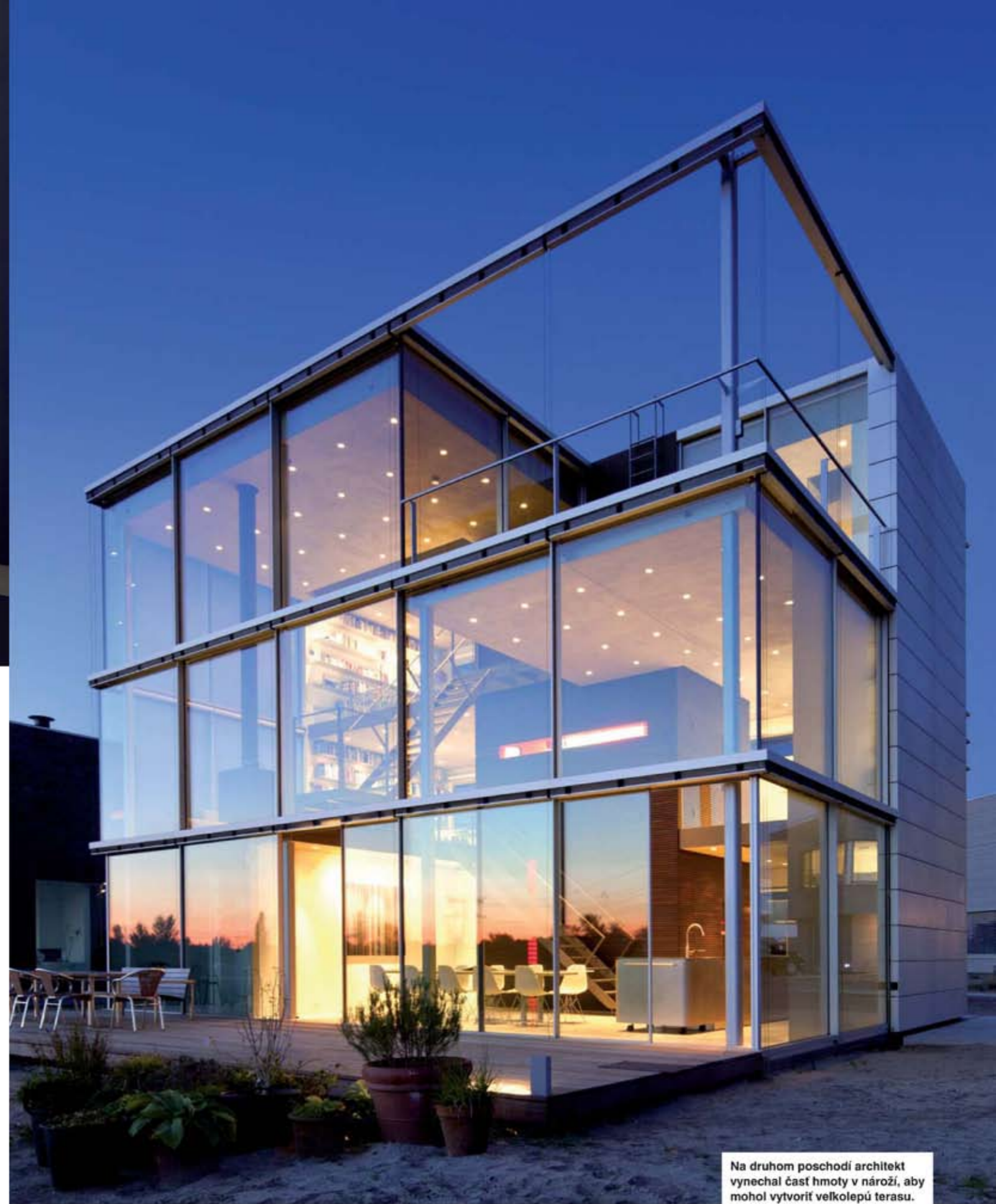
Na druhom poschodí architekt vynechal časť hmoty v nároží, aby mohol vytvoriť veľkolepú terasu.