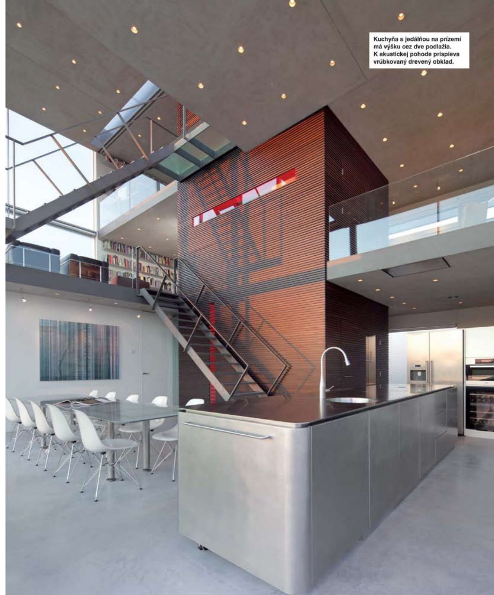
Kuchyňa s jedálňou na prízemí má výšku cez dve podlažia. K akustickej pohode prispieva vrúbkovaný drevený obklad.

Dispozíciu architekt so svojím tímom primárne rozdelil na dve časti: uzavretú, smerom do ulice a otvorenú, priehľadnú časť. Dve podlažia konzolovo vystupujú z uzavretej zóny smerom k vode a výhľadu. «Hlavnou myšlienkou, ktorá sprevádzala návrh domu, bol práve budúci výhľad na okolitú →