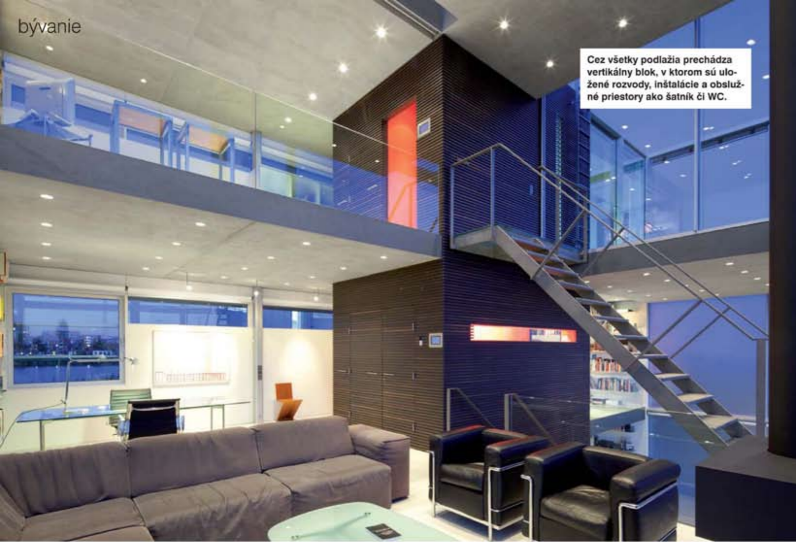
Cez všetky podlažia prechádza vertikálny blok, v ktorom sú uložené rozvody, inštalácie a obslužné priestory ako šatník či WC.