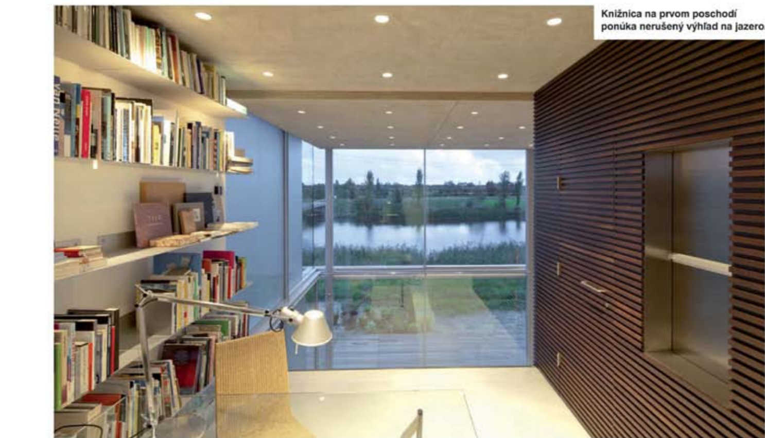
Knižnica na prvom poschodí ponúka nerušený výhľad na jazero.